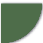
NCS S 5020-G30Y (Grön)