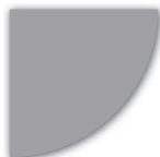
NCS S 3502-Y (Ljusgrå)