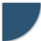
NCS S 5030-R90B (Blå)