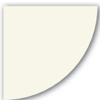
NCS S 0502-Y (Vit)

Våra ytterdörrar finns i vit som standardkulör, samt grå, grön, blå och röd som tillval. Ytterdörren är lackad i dubbla skikt av ett 2-komponentssystem som ger en mycket slitstark yta.