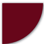
NCS S 5040-R (Röd)

Kulörprovers tryckfärger är endast vägledande och kan avvika mot produkterna.